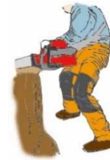
（図1）下肢の切創防止用保護衣

次の保護具等の選定に当たっては、防護性能が高いことはもちろんのこと、作業性が良く、視認性の高い目立つ色合いのものであって、人間工学に配慮した使いやすい機能を備えたものを選定すること。（① 下肢の切創防止用保護衣 （図1）、②衣服、③手袋、④安全靴等の履物、⑤保護帽、保護網・保護眼鏡及び防音保護具）